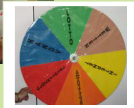
...und auch beim Flaschendreihen kommt man mit den SchülerInnen spielend über die Thematik ins Gespräch