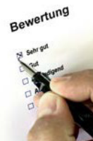
...am Ende gibt es noch ein Feedback für die Veranstalter und Give Aways für die SchülerInnen