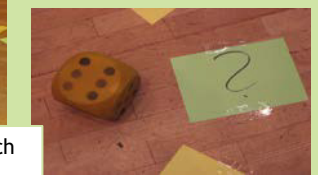
Beim „Mensch ärgere Dich nicht“ geht es um Computerspielsucht & Onlinespielsucht